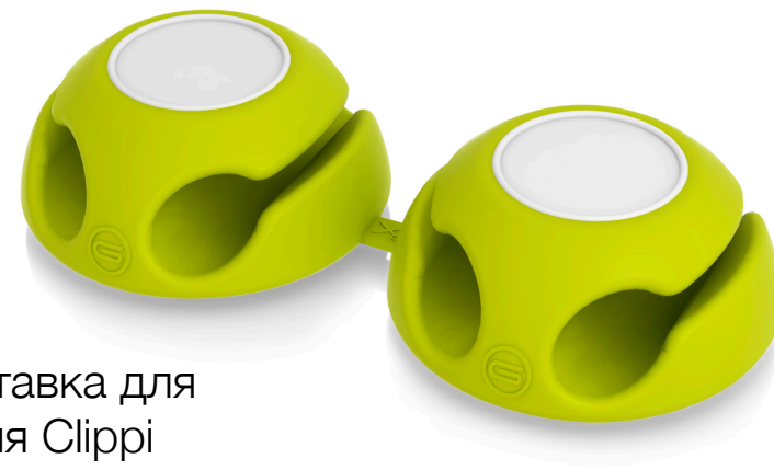
Подставка для кабеля Clippi 12345602