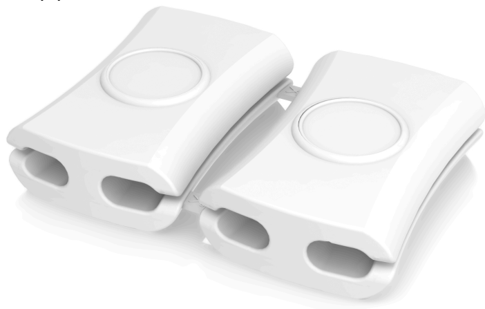
Органайзер для проводов Snappi 12345700